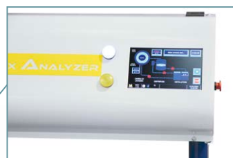
Display 7 pollici touch screen con interfaccia intelligente. Monitoraggio del test e interazione dell'utente in tempo reale.