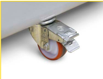
4 ruote integrate con il telaio per posizionamento e movimentazione piú facile della macchina.