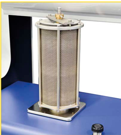
Bilancia integrata opzionale con salvataggio automatico dati (10 Kg \pm 0,1 g).