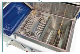
100% camera (di distillazione) in acciaio inossidabile facile da pulire. Dotata di spruzzatore di solvente sopra le resistenze.