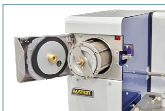
Il cestello entra perfettamente nella camera di lavaggio. La finestra di ispezione monitora il livello del solvente.