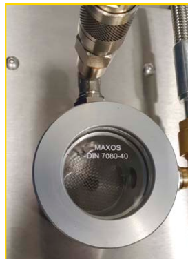
Ciclo completamente automatico. Grazie all'utilizzo di una elettrovalvola resistente al solvente.