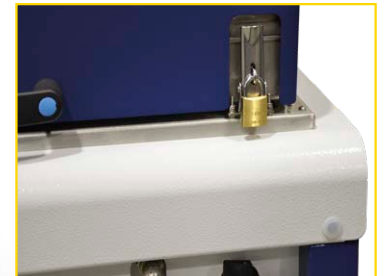
Chiusura di sicurezza della camera di distillazione per evitare qualunque apertura accidentale da parte dell'utilizzatore.