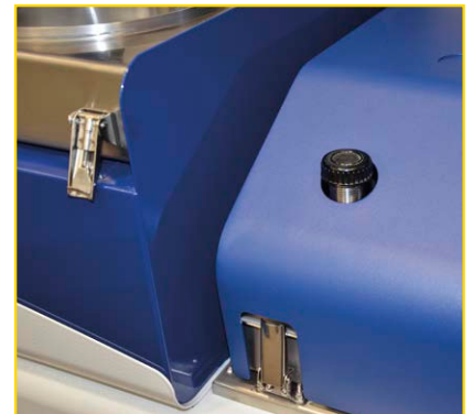
Possibilità di introdurre il solvente con una pompa a pedale o direttamente da un tubo posizionato sopra il coperchio del distillatore.