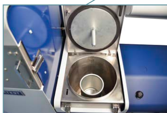
Centrifuga ad alta velocità. La finestra di ispezione sul coperchio è usata per monitorare il colore del solvente durante l'estrazione.