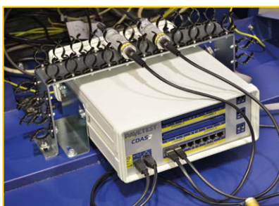
Sistema di controllo e acquisizione dati (CDAS) posizionato sotto la camera di prova.