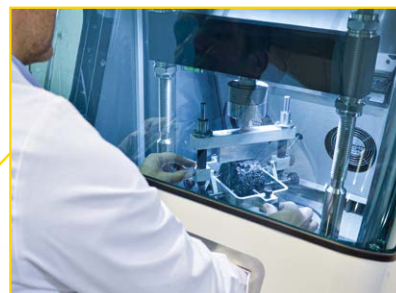
La piccola porta offre un facile accesso alla camera senza dispersione di temperatura.