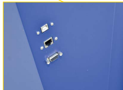
Ethernet, USB tipo B e porta seriale per la connessione.