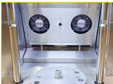
Potenti ventole di ricircolo.