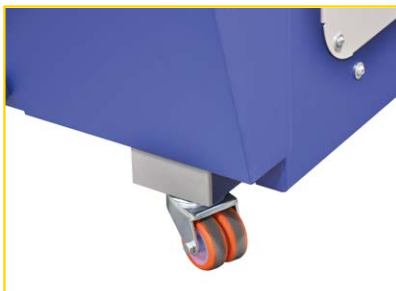
4 ruote per una movimentazione facilitata.